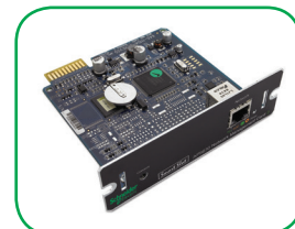
Placas de gestão