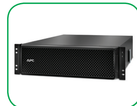
Banco de baterias