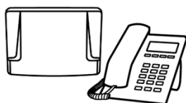
Central Telefônica e Telefone