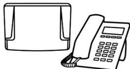
Central Telefônica e Telefone