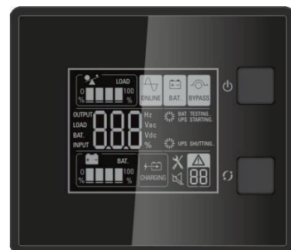
Display LCD com informações claras de status e indicadores do No-break