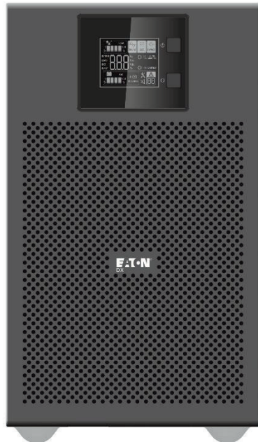
Eaton New DX 3000i